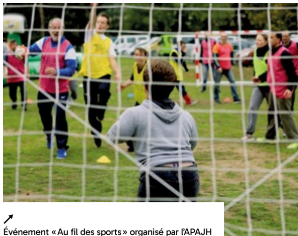
Événement « Au fil des sports » organisé par l'APAJH et la Fédération française du sport adapté (2017).